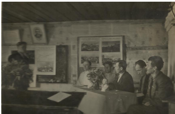
Экзамен по истории.