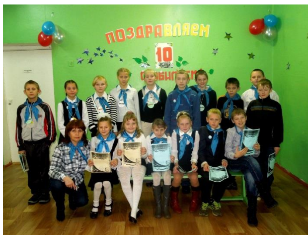
Праздник у организации «Гагаринец».