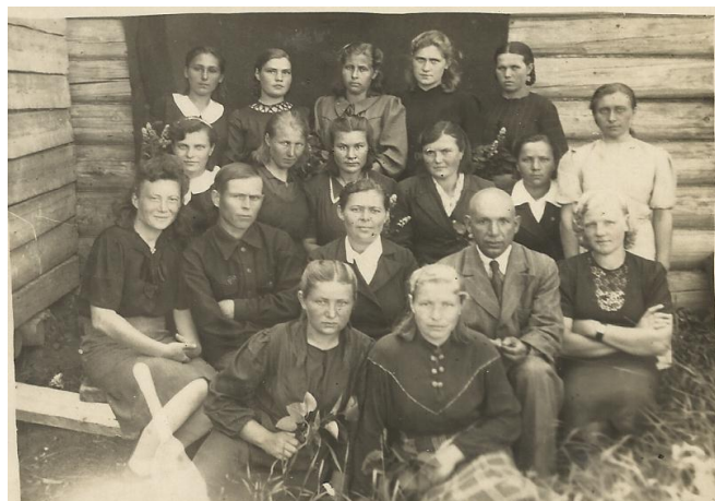
Первый послевоенный выпуск.

В 1946 году закончила Старосельскую среднюю школу, затем Вяземский Педтехникум, по распределению попала в родную школу, где и проработала в течение 40 лет учителем начальных классов. Была награждена Почётными грамотами.