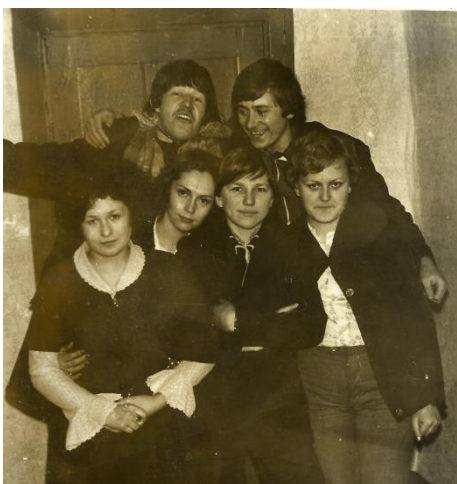
С воспитанниками интерната.